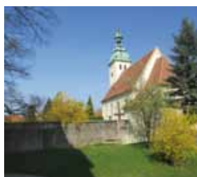
Ev. St. Georgskirche Daubitz