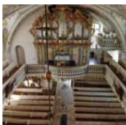
Kammerkonzert in der Ev. Hoffnungskirche Görlitz