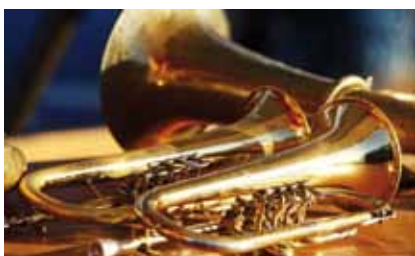
Landesposaunentag in der Lutherkirche Görlitz