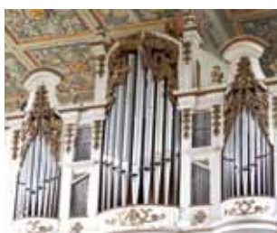
Orgel in der Kirche Arnsdorf