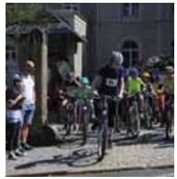
Regionaler Kinder- und Jungschartag

10. Mai 15:00 Uhr Sonntag Eintritt frei Kollekte