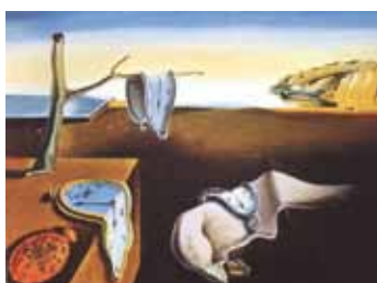
Wanderausstellung Salvador Dali, Frauenkirche Görlitz