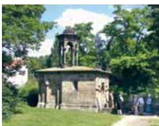
Tag der Via Sacra am Heiligen Grab, Görlitz