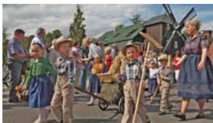
Sorbischer Heimattag Hoyerswerda