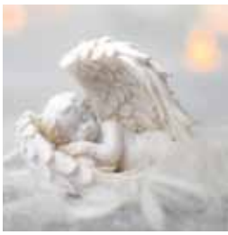
Kickstarter Aktion Engel