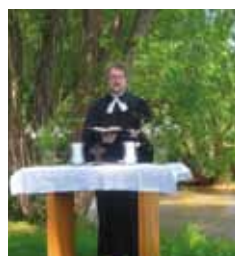
Open-Air-Gottesdienst am Spreeufer