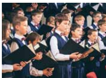
Knabenchor Dresden in der Christuskirche Niesky