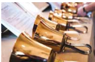
Chorkonzert zum Weihnachtsmarkt Nieder Seifersdorf