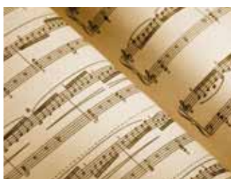
Eröffnungskonzert in der Stadtkirche St. Peter und Paul, Görlitz