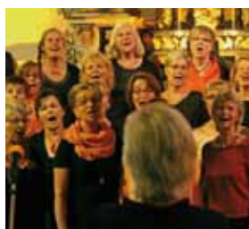
Der Gospelchor „Shine“ aus Bissendorf

12. Juli 9:30 Uhr Sonntag Eintritt frei Kollekte