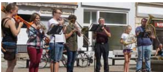
Atem, los! - Bläserfeierstunde zur Bläserfahrt

26. Juli 16:00 Uhr Sonntag Eintritt frei