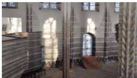
Soldatenbretter: Schrecken und Hoffnung, Nikolaikirche Görlitz

18. April 9:00 Uhr Sonabend kleine Spende