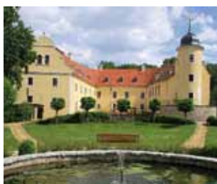
Schlosshof in Ebersbach