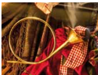
Hubertusmesse Nieder Seifersdorf