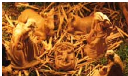
Johann Sebastian Bach: Weihnachtsoratorium, Görlitz Kreuzkirchez