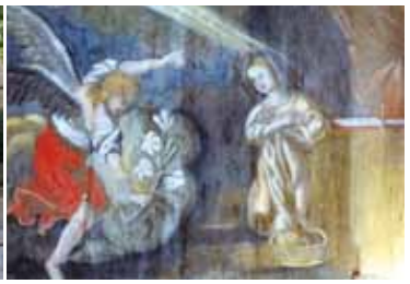
Wehrkirche Nieder Seifersdorf