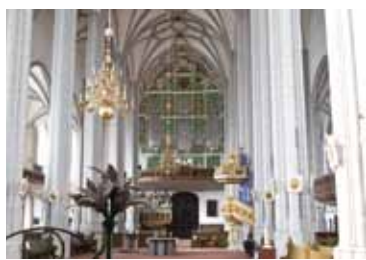
Kirche St. Peter und Paul, Görlitz