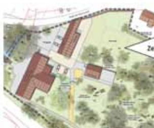
Treff am Backhaus, Ev. Kirchengemeinde Kodersdorf