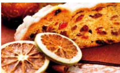
Ökumenische Nikolausandacht am 6. Dezember 2020, Görlitz