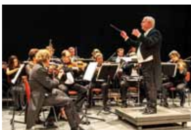
Sorbischen National-Ensembles Bautzen in der Ex. Kirche Klitten