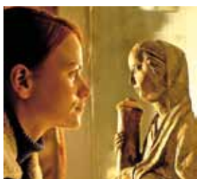
Tag der Via Sacra am Heiligen Grab, Görlitz