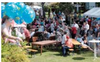
St. Martin im Sommer, Rothenburg