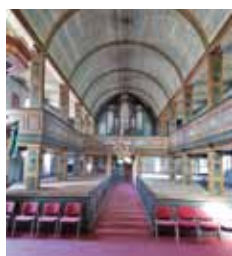
Ev. Kirchengemeinde Rietschen