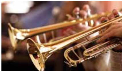
Bläserkonzert im Advent, Ev. Kirche Melaune