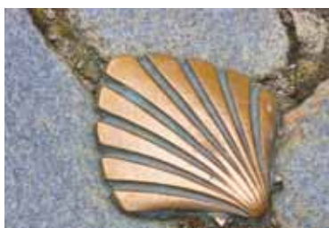
Pilgerweg zum Lausitzkirchentag