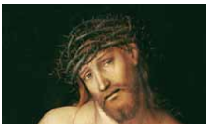
Passion-Oratorium von Carl Loewe