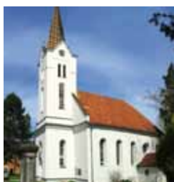
Jakobskirche Bad Muskau