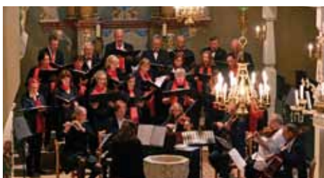
Kirchenchor St. Barbara Kirche zu Ebersbach