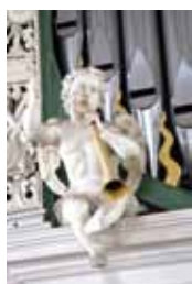
Kirche St. Peter und Paul Görlitz