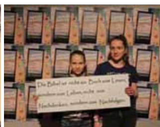
JesusHouse Jugendwoche, Görlitz