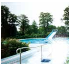
Gottesdienst zum Schuljahresbeginn im Freibad Ortrand