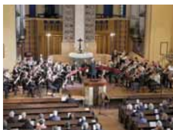
Abschlusskonzert des Seminars für Blechbläser