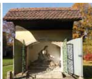
Heiliges Grab Görlitz

10. April 17:00 Uhr Freitag Eintritt frei