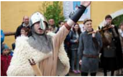
16. Historischer Markt, Horka