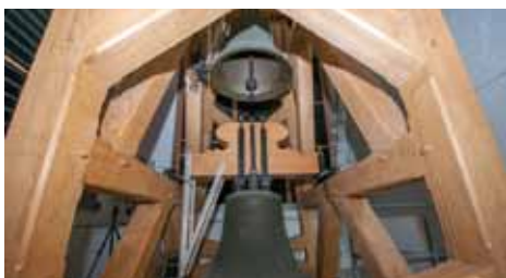
Festgottesdienst „5 Jahre Glockenturm King-Haus“