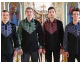
Orthodoxe Gesänge aus der Ukraine