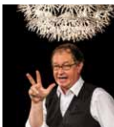
Das Faultier im Dauerstress, Kirche Kodersdorf