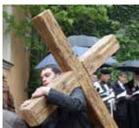
Kreuzwegprozession von der Krypta der Peterskirche