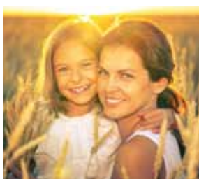
4. Frauenfrühstück Krauschwitz