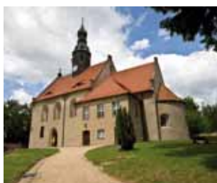
Stadt & Dorf sind anders reich, Kirche Arnsdorf