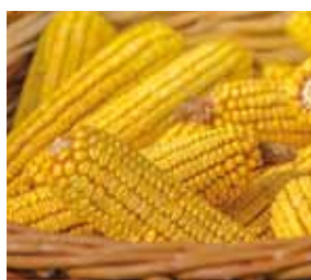
Erntedank-Mahl, Kirche Arnsdorf