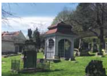
Historischer Nikolaifriedhof Görlitz