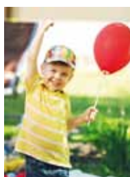
Sommerfest Christuskirche Niesky