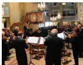
Posaunenchor St. Barbara Kirche zu Ebersbach