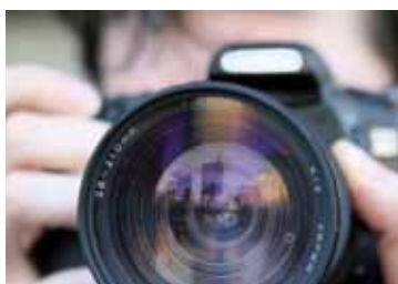
Fotoausstellung Frauenkirche Görlitz