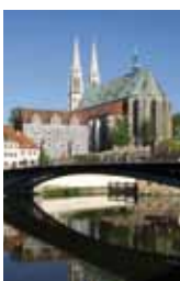
Kirche St. Peter und Paul Görlitz