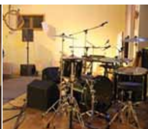
Kickstarter - der Jugendgottesdienst mit „Kick“