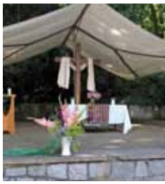
Sommertagesdienst mit Kinderfest