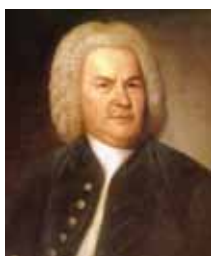
Bachwoche in Görlitz