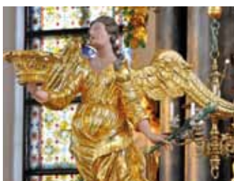
Ev. Hoffnungskirche Görlitz